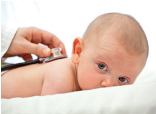
Direkt nach der Geburt erfolgt die U 1