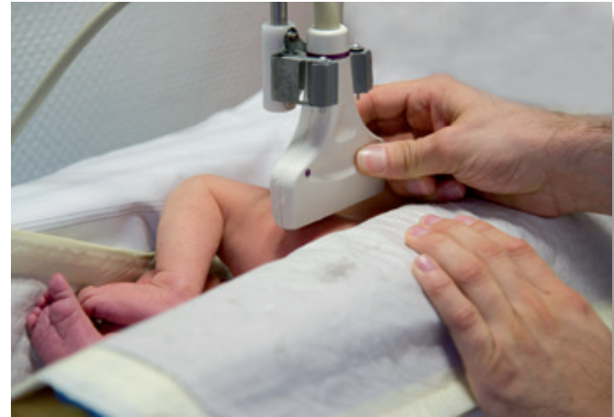
Hüftultraschall eines Neugeborenen durch einen Orthopäden unserer Klinik

Während des stationären Aufenthaltes wird bei Auffälligkeiten bei Ihrem Baby ein sogenanntes Hüftscreening zum Ausschluss von Veränderungen der Hüftgelenke durchgeführt. Diese Untersuchung wird in Zusammenarbeit mit unseren Kollegen im Zentrum für Orthopädie, Unfallchirurgie und Sportmedizin aus dem Haus St. Petrus angeboten.